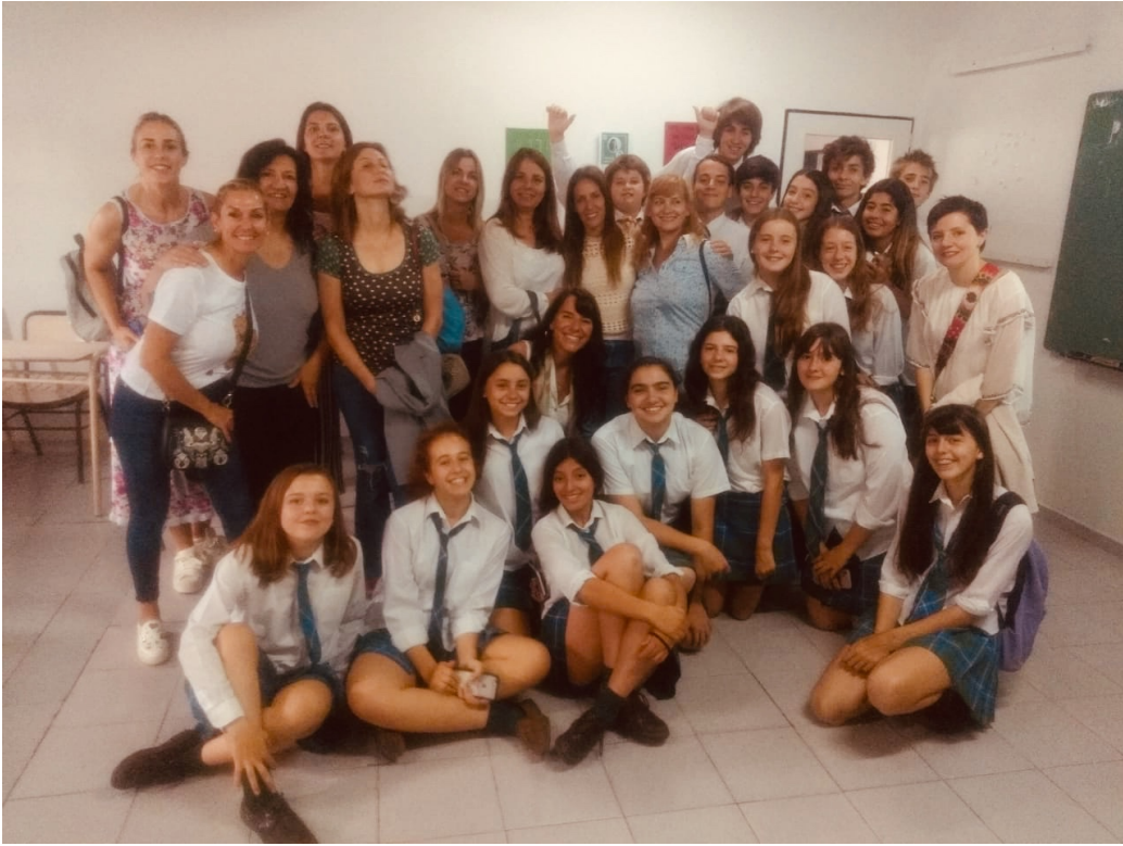
Alumnos y padres de 2° B al finalizar el taller