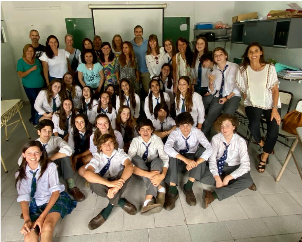
Alumnos y padres de 2° A al finalizar el taller